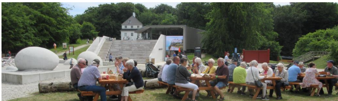
Madpakker på Møn 2022