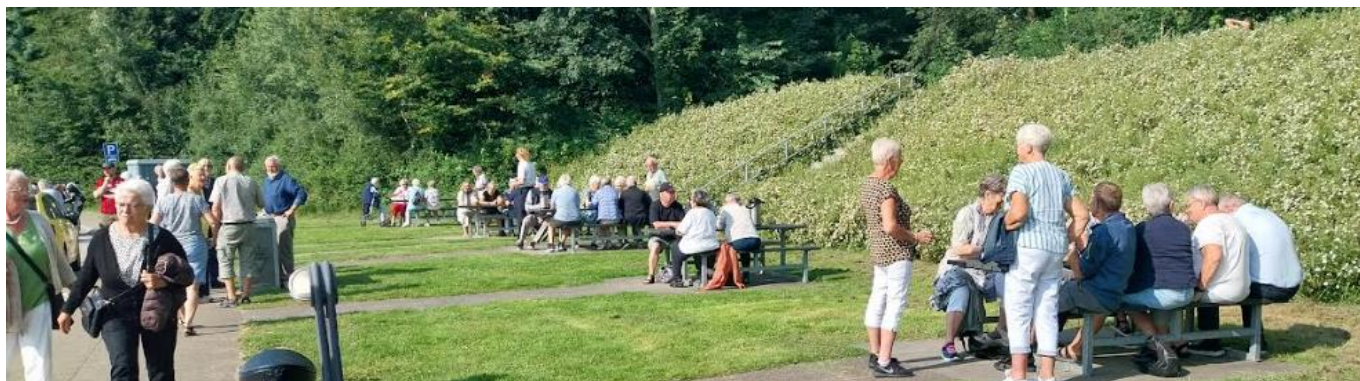
Buskaffe – Rasteplass Himmerland 2024