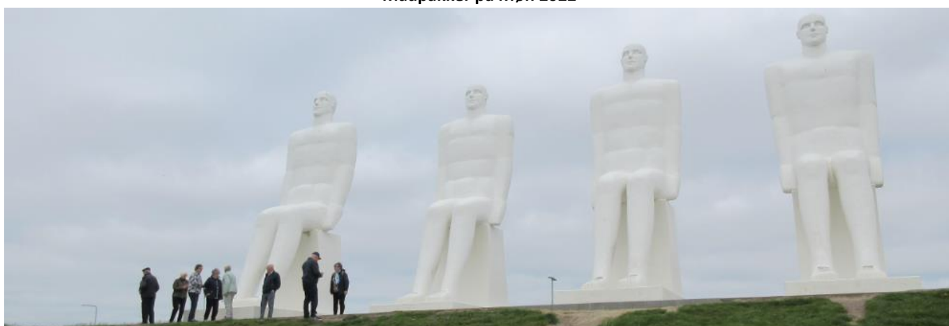
Mennesket ved Havet i Esbjerg 2021