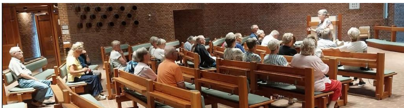
Søndermarkskirken i Viborg 2024