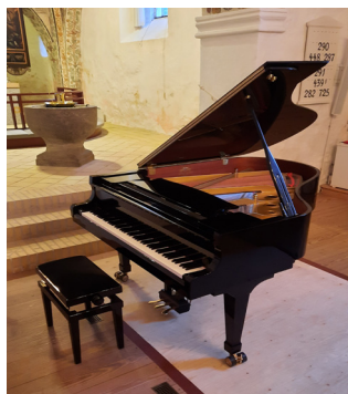
I Sønderholm Kirke har vi desuden et Kawai flygel.