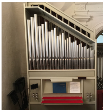
I Sønderholm Kirke har vi et orgel fra Bruno Christensen & Sønner 1979 med 10 stemmer fordelt på manualer og pedal.

Ansættelse sker ved Sønderholm Frejlev Sognes Menighedsråd beliggende Verdisvej 4, 9200 Aalborg SV.